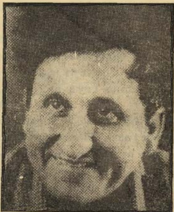
א. ב. יהושע:

לקראת שנת הלימודים תשל"ח, ובעיקבות המגמה לשנות את הדגשים בתוכניות הלימודים פנינו לשורה של ספרים-פרוזאיקונים בבקשה להשיב על שתי שאלות: 1. האם יש מקום לפירוש דתי לערכים הלאומיים במסגרת תוכניות הלימודים? 2. מה ההקף הרצוי לדעתך ללימודי "תרבות העולם": הומניסטיקה, היסטוריה וכו'...?